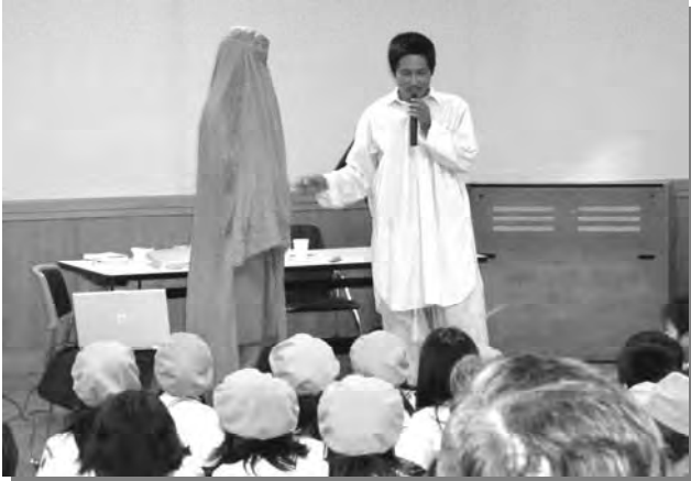
スカウトクラブ員による教会バザーのポスター完成