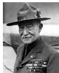
ベーデン・パウエル卿の言葉

困難は神の祝福なしではありません。 若者の進む先に大きなチャンスと活躍の場を開きます。