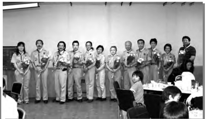
5月8日（土）育成会総会終了後、スカウト教育にいつも奉仕して下さるリーダーに感謝する会を開催しました。