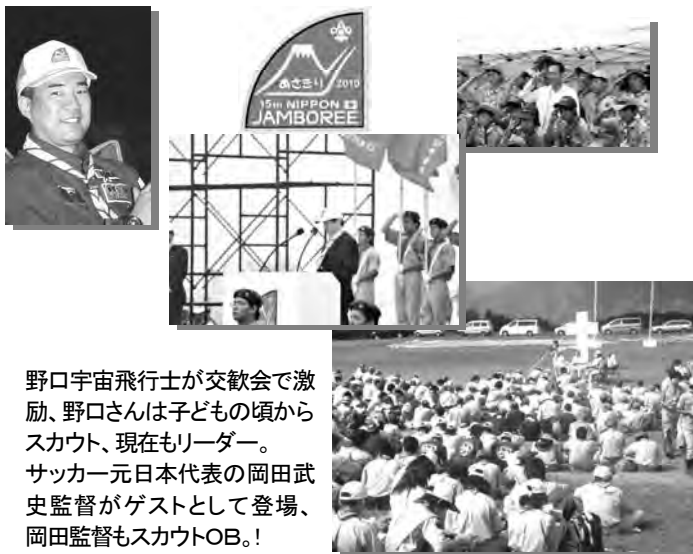
野口宇宙飛行士が交歓会で激励、野口さんは子どもの頃からスカウト、現在もリーダー。サッカー元日本代表の岡田武史監督がゲストとして登場、岡田監督もスカウトOB！